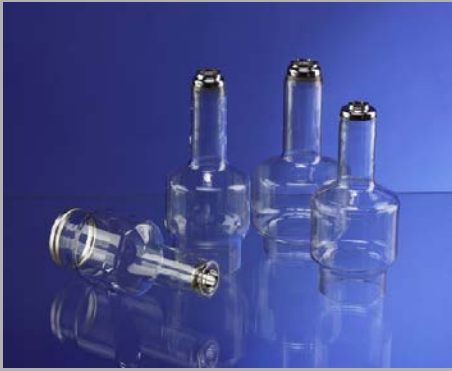
Drehanoden / Glaskolben