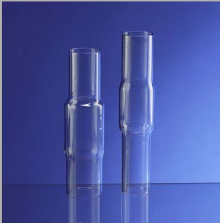
Festanoden / Glaskolben